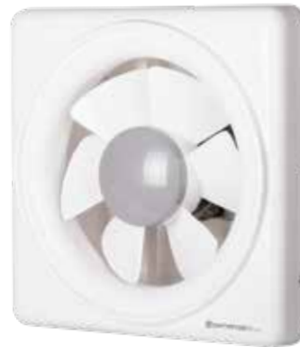
هواکش خانگی با دمپرو کلید دستی

VSL axial extractors are specially designed for ventilation of small and medium rooms, kitchens and office spaces.